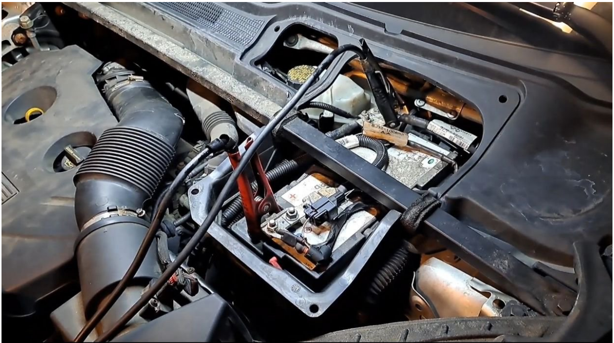
B1B72-11 Lin BUS 1- power supply 2017 Land Rover RANGE ROVER EVOQUE

https://www.bekomcar.com/zh-hans/qa/s01kypdmb/