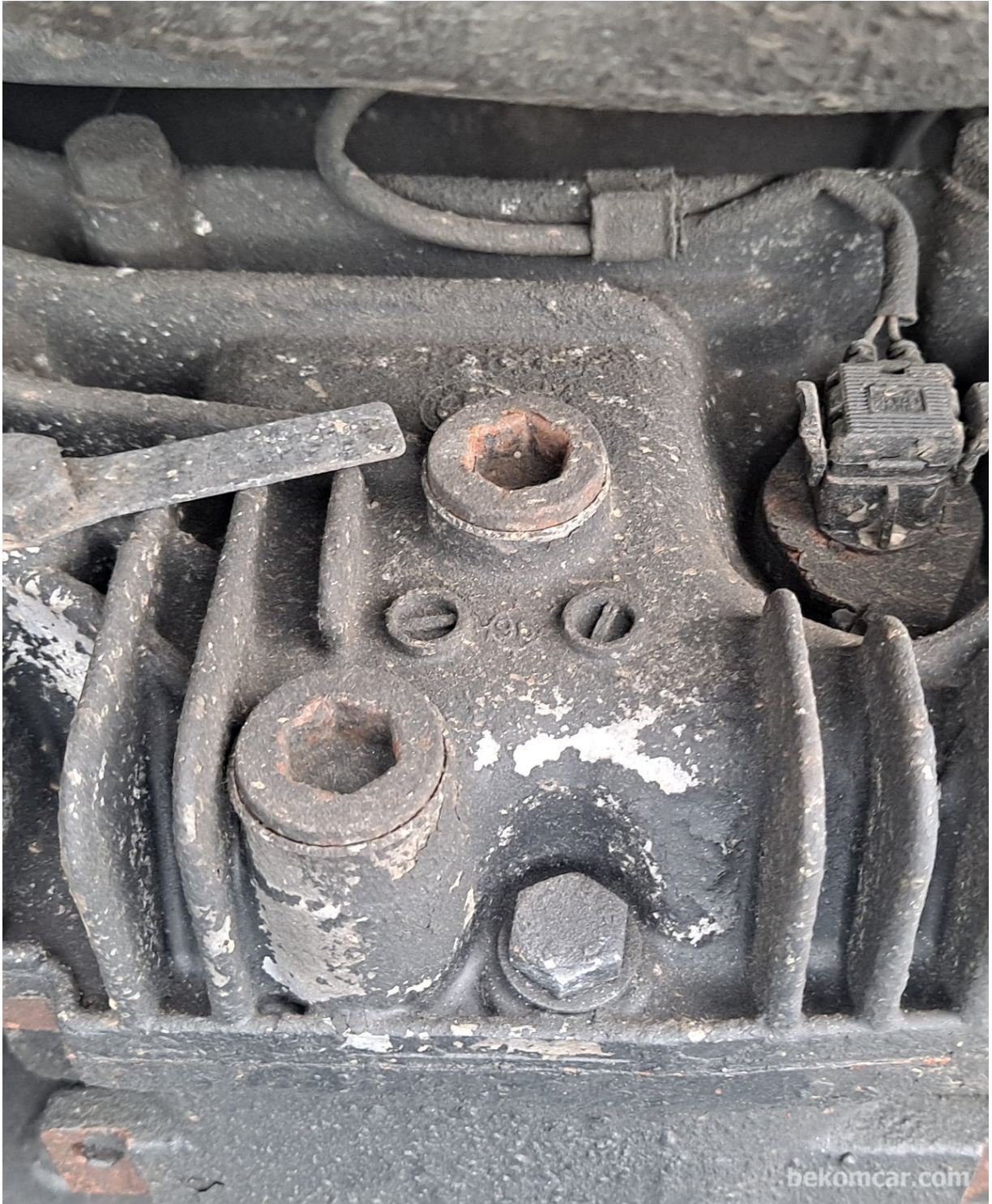
BMW 디퍼오일 필 플러그와 드레인플러그 위치이다. 위쪽이 데후오일 필 플러그이다. 같은 BMW도 연식에 따라 조금씩 다르다.